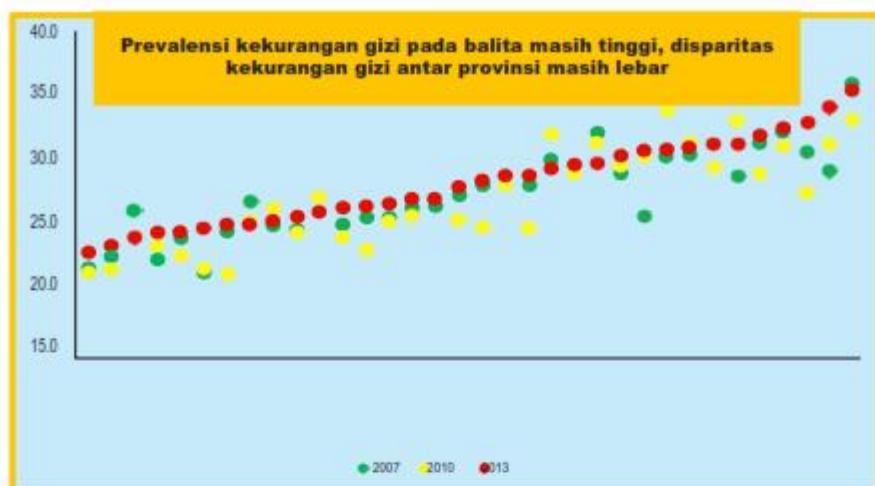
Sumber: RPJMN 2015-2019