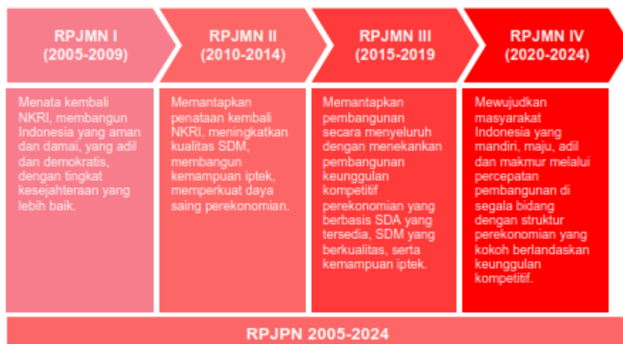
Sumber: RPJPN 2005-2025

Penyusunan arah kebijakan dan strategi nasional dalam RPJMN 2015–2019 berpedoman pada RPJPN 2005–2025 sebagaimana tertuang dalam UU Nomor 17 Tahun 2007. Untuk pelaksanaannya, RPJPN 2005–2025 dibagi dalam empat tahap, yakni RPJMN I (2005–2009), RPJMN II (2010–2014), RPJMN III (2015–2019), dan RPJMN IV (2020–2024). Masing-masing tahap memiliki tujuan pembangunan nasional sebagaimana terlihat pada Gambar 3.