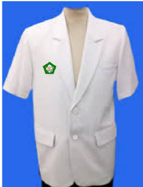
Gambar 1 : Pakaian Dinas