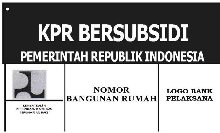
Contoh Format D

LAMPIRAN IV PERATURAN MENTERI PEKERJAAN UMUM DAN PERUMAHAN RAKYAT NOMOR TAHUN 2014 TENTANG PETUNJUK PELAKSANAAN FASILITAS LIKUIDITAS PEMBIAYAAN PERUMAHAN DALAM RANGKA PEROLEHAN RUMAH MELALUI KREDIT/ PEMBIAYAAN PEMMILIKAN RUMAH SEJAHTERA BAGI MASYARAKAT BERPENGHASILAN RENDAH