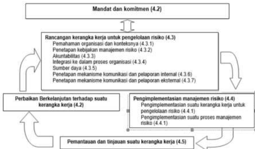
Kerangka Kerja Manajemen Risiko